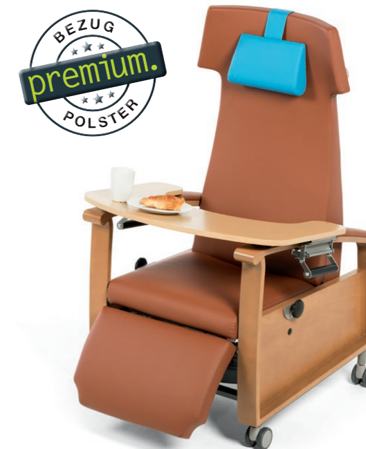
RELAX 2 mit aufgesetztem Patiententisch