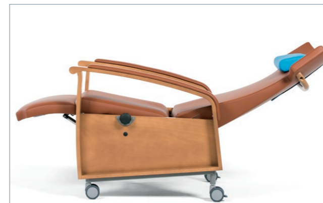
RELAX 2 ohne Seitenteile in Ruheposition