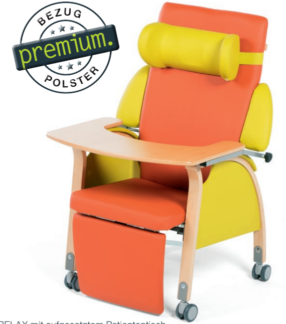
RELAX mit aufgesetztem Patiententisch