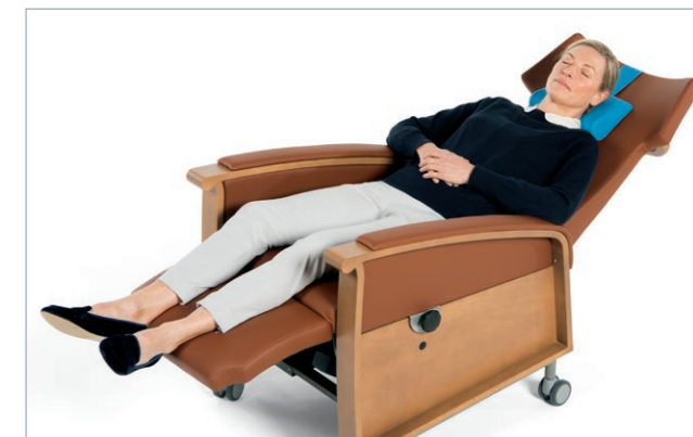
Wohlfühlmosphäre mit RELAX 2 in der Pflege oder Klinik