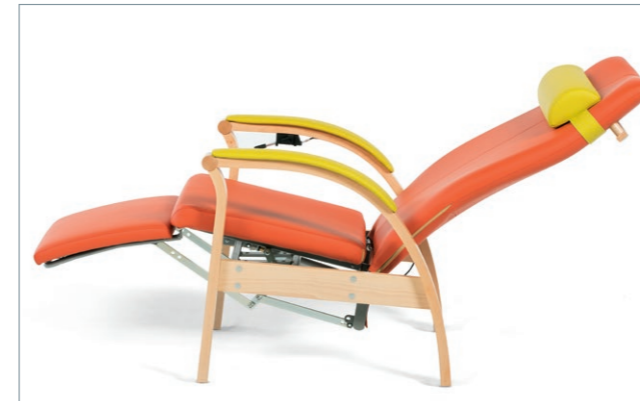
RELAX ohne Seitenteile in Ruheposition