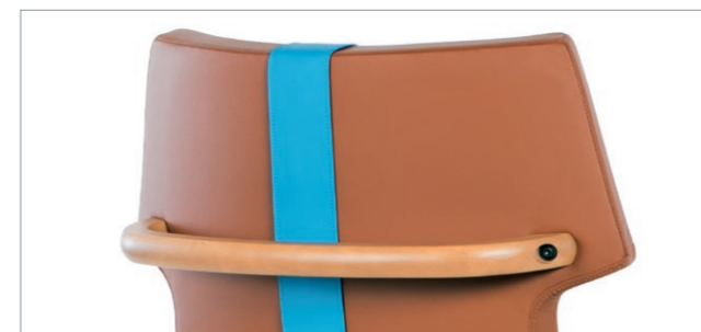
Ergonomisch angebrachter Schubbügel (Zubehör)