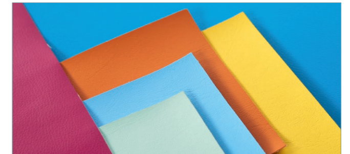
Vielfältige Farbvarianten in den Bezugsstoffen compact und premium