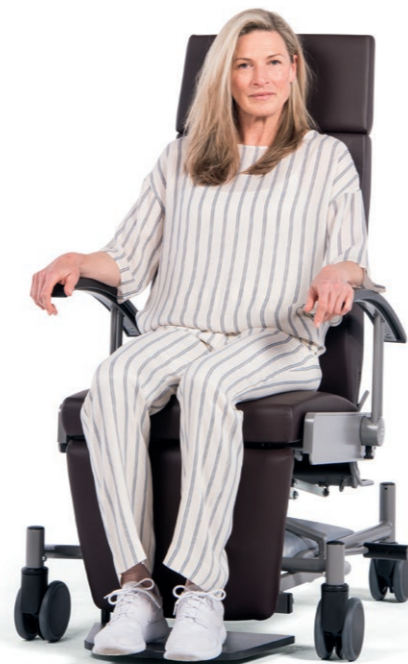
CareLine. Pflege- und Mobilisationsstuhl. Siehe Website.

Mit gutem Sitz wird vieles leichter – Entspannung pur ist Lebensqualität. Sitz- und Liegekomfort über kürzere und längere Abschnitte eines lebendigen Tagesablaufs tragen in hohem Maß zu Wohlbefinden und Zufriedenheit älterer Menschen in der Pflege bei. Zugleich entlasten zufriedene Bewohner und Patienten das Pflegepersonal ganz enorm. Menschen brauchen Pflege aus verschiedenen Gründen: nach einer längeren Zeit im Krankenhaus; wenn es ihnen schwer fällt, allein zurechtzukommen; wenn die geistigen Kräfte nachlassen. In vielen Bereichen moderner Pflegeeinrichtungen schaffen GREINER Ruhesessel und -liegen eine neue Form von Wohn- und Pflegekultur in ansprechendem Ambiente. Das Spektrum reicht von der Tagespflege über das Betreute Wohnen bis zur geriatrischen Pflege – von Ruhe und Entspannung bis zu Mobilisation und Transport.