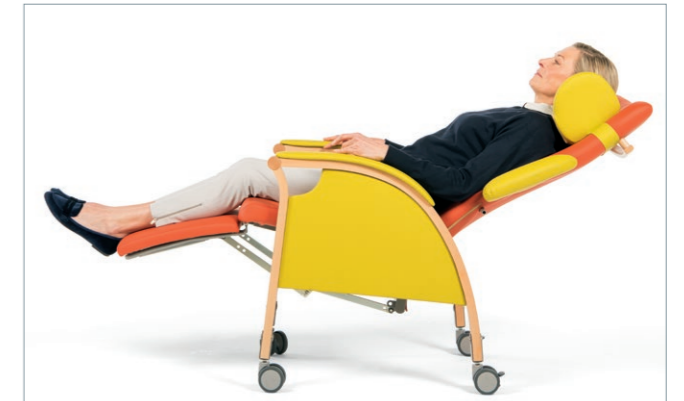
Wohlfühlmosphäre mit RELAX in der Pflege oder Klinik