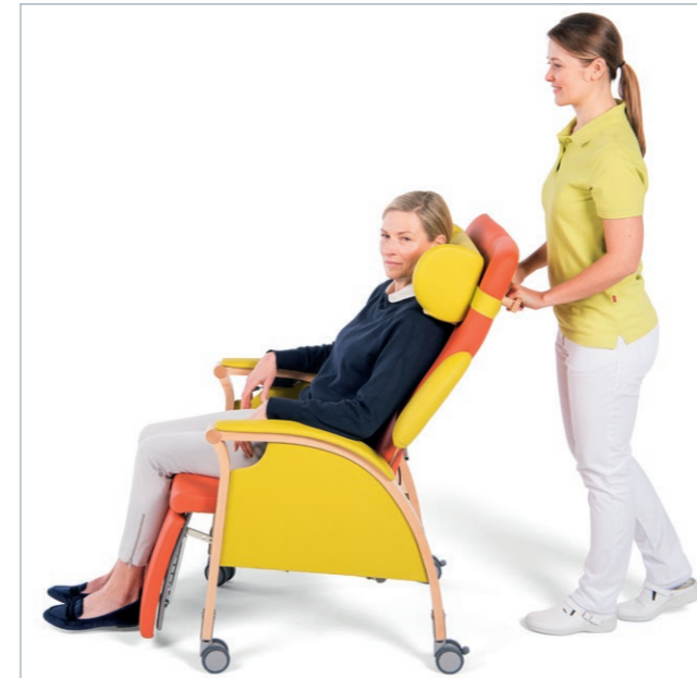
Mobilität mit RELAX in der Pflege

Die Ruheliege RELAX sorgt rundum für Behaglichkeit. Rückenlehne und Beinauflage sind stufenlos und synchron um circa 50° bis zur Ruhelage verstellbar, wahlweise elektrisch oder manuell über eine Gasfeder. Zudem ist die separate Verstellung des Beinteils um bis zu 90° möglich. In Relaxposition hebt sich das Sitzpolster vorne um 10° und verhindert somit das Abrutschen der sitzenden Person. Besondere Entspannung bringt die Schaukelwippen-Funktion, die einfach über den Verstellhebel unter der Armlehne bedient wird. Sitzpolster und Bezug sind abnehmbar. Die festen und weit nach unten gezogenen Armlehnen geben Sicherheit und Komfort beim Liegen, die abgerundeten Griffknäufe vorne unterstützen das Aufrichten beim Aufstehen. RELAX gibt es als Standmodell und fahrbar auf Doppelaufrollen. Diese sind hinten feststellbar.