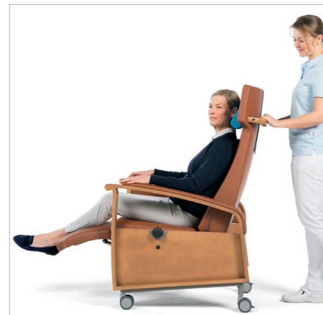
Mobilität mit RELAX 2 in der Pflege

RELAX 2 besteht in Form eines Sessels durch eine völlig neuartige Technik der Rückenlehnen- und Beinauflagenverstellung über zwei Gasdruckfedern, die sowohl eine synchrone Verstellung der Liegefläche, als auch eine separate Verstellung der Beinauflage in jeder Position zulassen. Die elektrisch verstellbare Variante ist mit 2 Motoren ausgestattet. Ein leistungsstarker Akku gewährleistet die erforderliche Mobilität. Die Erweiterung der Rückenlehnenverstellung in Richtung waagrechte Liegeposition, der im Polster eingelassene viskoelastische Schaum, ebenso wie die ergonomische Formgebung, bieten ein Höchstmaß an Sitz- und Liegekomfort. Die Seitenteile aus Buchenholz, wischdesinfektionsbeständig mit DD-Lack lackiert, sind ansprechend im Farbton Havanna gebeizt. Der weite Schwung der Armlehnen über die Rückenlehne hinaus bietet eine vollständige Unterstützung der Arme auch im Liegen und erleichtert das Aufrichten aus der Ruheposition. 75-mm-Schwenkrollen, hinten feststellbar, und ein ergonomisch angebrachter Schubbügel (Zubehör) erleichtern die Mobilität für das Pflegeteam.